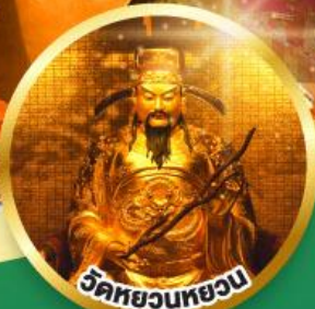
วัดหยวนหยวน ขอพรเรื่องสุขภาพ, โชคลาภ ความเจริญก้าวหน้า

เมนูพิเศษ! ต้มช้ำฮ่องกง, บุฟเฟต์ชาบูสไตล์ฮ่องกง, ห่านย่าง