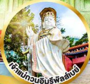
เจ้าแม่กวนอิมรัฟลอสบซี่ ขอพรรับพลังงานดี เสริมพลังดวงจัญ