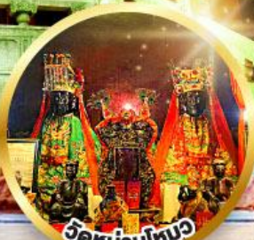
วัดบ้านใหม่ ขอพรเรื่องการศึกษา, การงาน สติปัญญาและความกล้าหาญ