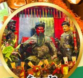
วัดกวนโก ขอพรเทพเจ้ากวนอู เงินทอง, ธุรกิจมั่นคง