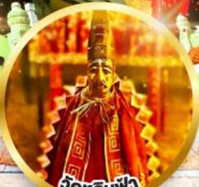
วัดลีนฟ้า ขอพรเสริมโชคลาภในธุรกิจ และการเงิน