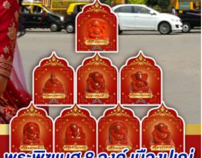
พระพิฆเนศ 8 องค์ เมืองปูณ