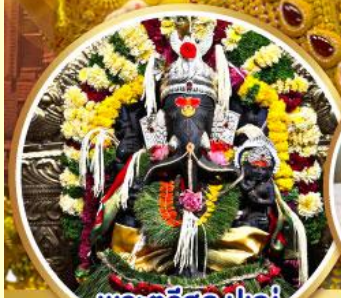
พระตรีศูล ปูณ (Trishul Pune)