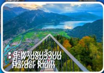
• สู่พวนชมริบเบิน Harder Klettersteig