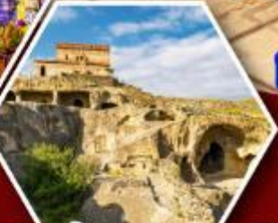
เมืองท้ำอิพลิสตซิเคท