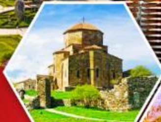
อิทราลวารี