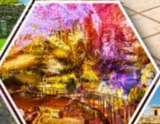
ท้ำไฟรมบิธิลูล