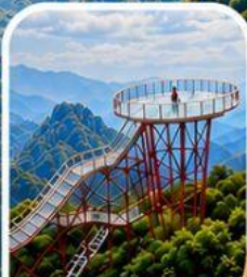
เขาเจ็ดดาว จุดชมวิวสุดหวาดเสียว