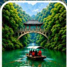
ลำธารหลงจินซี ชมธรรมชาติสุดอลังการ