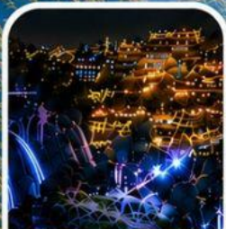
เมืองโบราณฟูหรงเจิน หมู่บ้านโบราณกลางหุบเขา