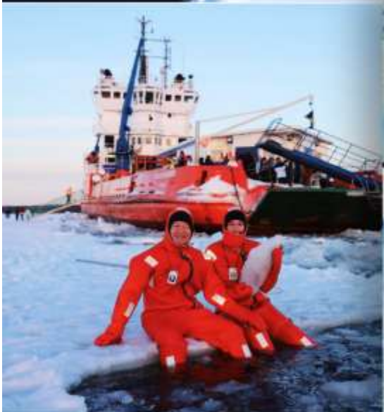
Polar Icebreaker Apr 2027