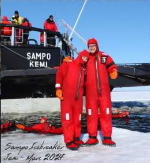
Sampo Icebreaker Jan - Mar 2027