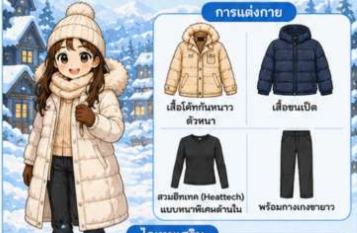
เสื้อโค้ทกันหนาว ตัวหนา