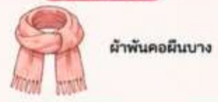
ผ้าพันคอผืนบาง