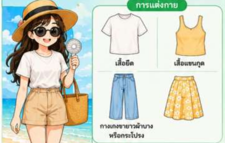
เสื้อยืด