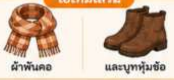
ผ้าพันคอ