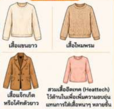
เสื้อแขนยาว