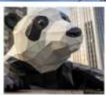
ห้าง IFS หมีแพนด้าเป็นตึก