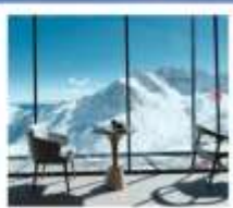
4860 COFFEE SHOP