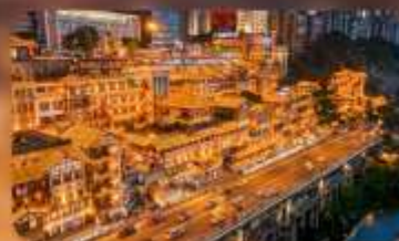
หงหย่าต้ง