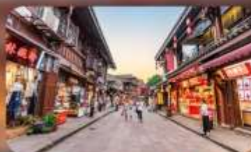
หมู่บ้านโบราณฉีโง่ว