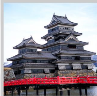
“MATSUMOTO CASTLE PARK”

สัมผัสความงดงามด้านนอก “ปราสาทมัตสึโมโตะ” ที่ตั้งตระหง่านท่ามกลางฉากหลังของเทือกเขาแอลป์ตอนเหนือ เปลี่ยนอิริยาบถ “ส่องเรือชมหุบเขาอะนะเคียว” ชมความงดงามธรรมชาติ ต้นไม้ หน้าผา และสะพานแดงอันโด่งดัง ตื่นตากับการประดับไฟกว่า 5 แสนดวง กับงาน “YAMANAKAKO ILLUMINATION FANTASEUM” ริมทะเลสาบยามานากะ สนุกสนานกับการเล่นหิมะ ในกิจกรรมต่างๆ ณ “FUJITEN SNOW PARK” พร้อมวิวภูเขาไฟฟูจิเป็นฉากหลัง ตระการตา “เทศกาลประดับไฟฤดูหนาว” ในธีมต่างๆหลากหลายโซน จัดแสดงไฟกว่า 2 ล้านดวงที่ยิ่งใหญ่ติดอันดับ1 ของญี่ปุ่น เปลี่ยนอิริยาบถ “นั่งกระเช้าฮาคุบะ อิวะตะกะะ” เพื่อชมวิวเทือกเขาแอลป์ญี่ปุ่นกับทิวทัศน์ฤดูหนาวแบบพาโนรามา