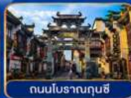
ถนนโบราณถุนซี