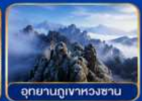
อุทยานภูเขาหวงซาน