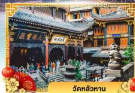
วัดหลัวหลาน