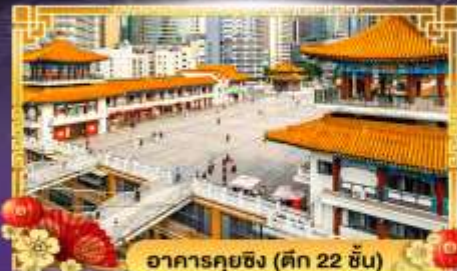
อาคารคุยฉิ่ง (ตึก 22 ชั้น)