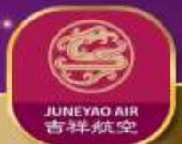
JUNEYAO AIR 吉祥航空

สัมผัสความงามแห่งเจียงหนาน ชมวิวสุดประทับใจ เที่ยวเมืองดังแห่งแดนมังกร