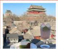
คาเฟ่ น้ำตาล