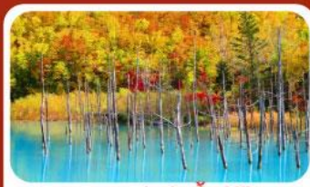
บลูพอนด์ (บ่อน้ำสีฟ้า)