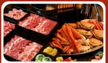
บุฟเฟ่ต์ซาบุมิ 3 ชนิด