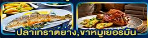
ปลาเทราตย่าง, วาหหมูเยอรมัน

Season of romance.. Germany Austria Czech Slovenia Hungary