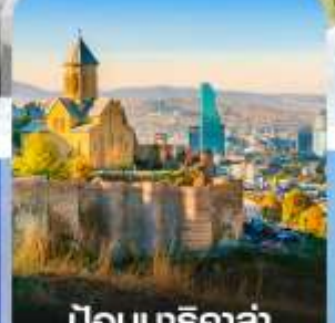
ป้อมนาริ کالا