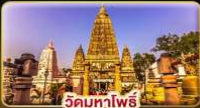
วัดมหาโพธิ์