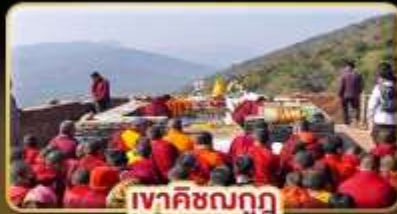
เทศกาลนวกฏ