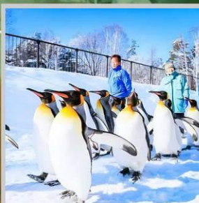
"PENGUIN ASAHIYAMA ZOO"