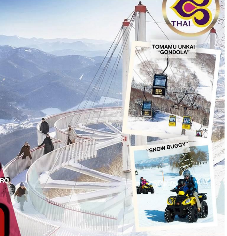
TOMAMU UNKAI "GONDOLA"