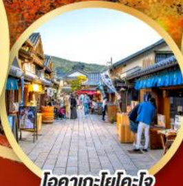
โอคากะโยโคโจ