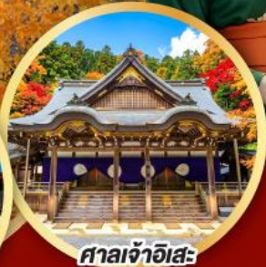
ศาลเจ้าฮิสะ