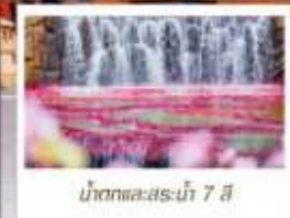
น้ำตกและสระน้ำ 7 สี

📦 โหลด 23 KG. x1 ทิ้งไป - กลับ ✓ ฟรีนียบตัว ✓ ไม่เข้าร้านรัฐบาล ✓ ทิวทัศน์เล็ก ✓ รวมค่าเข้าชมสถานที่ตามโปรแกรม