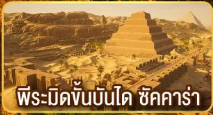
พีระมิดขั้นบันได ชิคคาร์่า