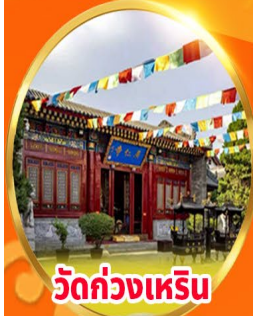
วัดกวางเหริน