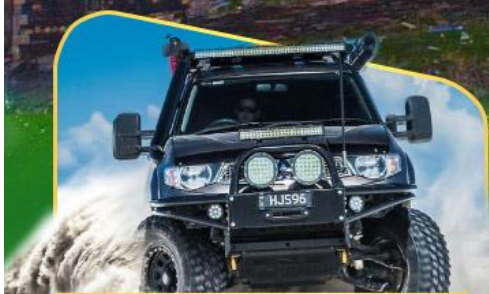
คันรถ 4WD สู้อีกกลางเทือกเขาคอเคซัส