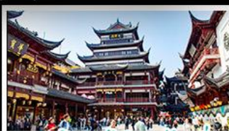
ตลาดร้อยปีฉิงหวงเหมียว