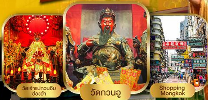
เจ้าแม่กวนอิม อ่องฮ่า

ฮ่องกง ช้อปปิ้งเต็มๆฟรีเดย์ 1 วัน ไหว้พระ 5 วัดดัง