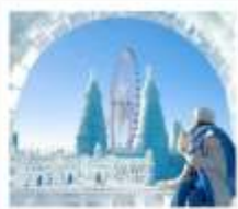
ICE & SNOW FEST.