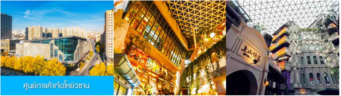
ศูนย์การค้าเจ้อโหย่วซาน

นำท่านเที่ยวชม ศูนย์การค้าเจ้อโหย่วซาน 这有山 แหล่งช้อปปิ้งชั้นนำที่ผสมผสานระหว่างสถานที่ท่องเที่ยว และแหล่งรวมร้านค้า และร้านแนวฟาสต์ฟู้ด อาหารพื้นเมืองร่วมสมัย ภายใต้คอนเซ็ปต์ แหล่งช้อปปิ้งบนภูเขา และบนภูเขามิแหล่งช้อปปิ้ง เป็นจุดเช็คอินยอดนิยมที่เปิดให้คนพื้นที่และนักท่องเที่ยวเข้าชมตั้งแต่ปี ค.ศ. 2019