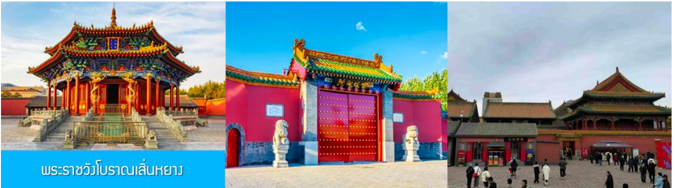
พระราชวังโบราณเสิ่นหยาง

จากนั้นนำท่านเดินทางสู่ เมืองเสิ่นหยาง 沈阳 (ระยะทาง 280 กม. ใช้เวลาเดินทางราว 3 ชั่วโมงเศษ) เที่ยง รับประทานอาหารกลางวัน ณ ภัตตาคาร (8)