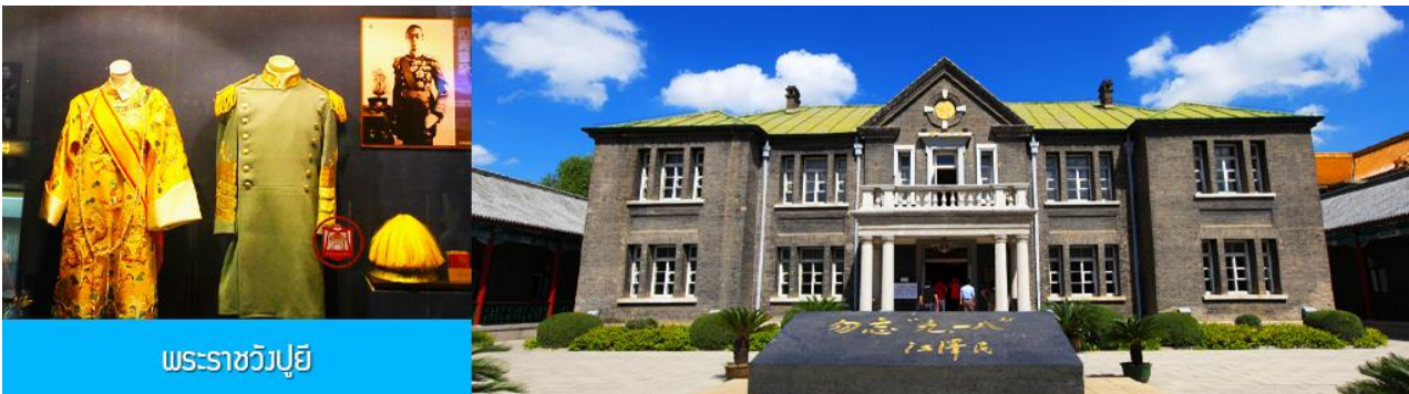
พระราชวังปู้ยี้

รับประทานอาหารเช้า ณ ห้องอาหารของโรงแรม (7)