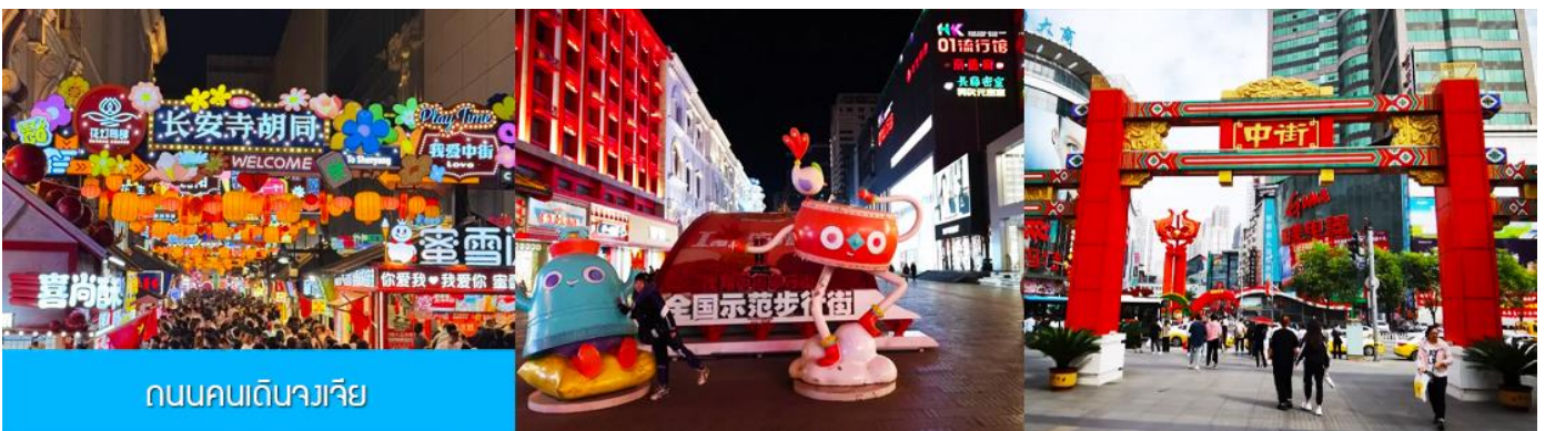
ถนนคนเดินจวงเจีย