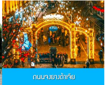
ถนนยาวต้าเจีย