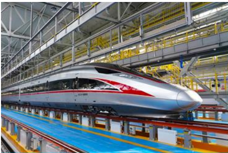
บัวร์รถไฟความเร็วสูง