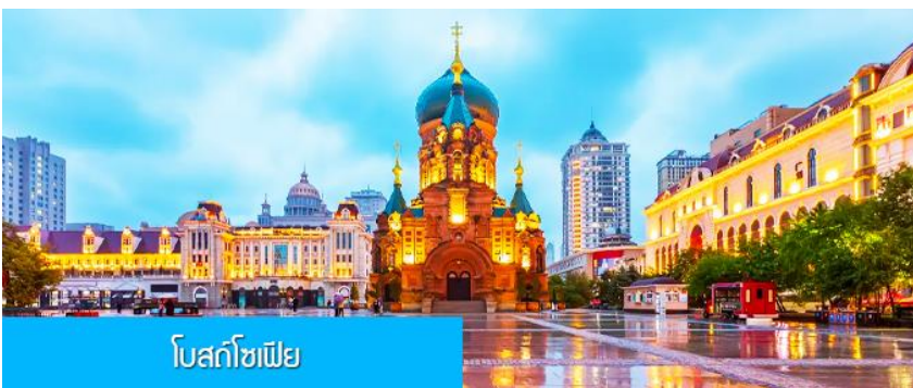
โบสถ์โซเฟีย