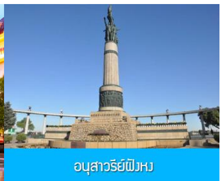
อนุสาวรีย์พิงหว