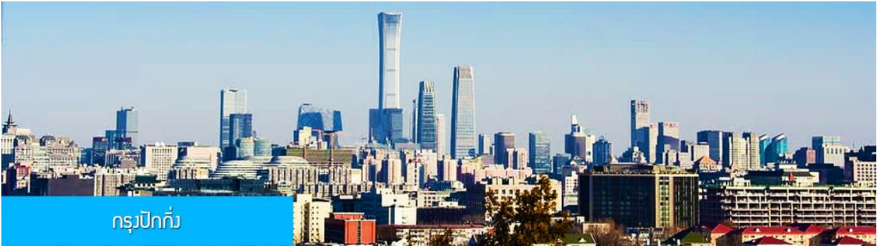
กรุงปักกิ่ง