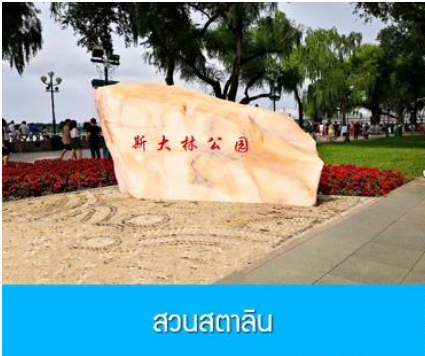
สวนสตาลิน