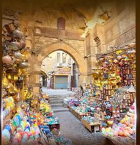
ตลาดห่านเวลกาลลี