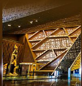
พิพิธภัณฑ์เกรนด์อียิปต์ (GEM)