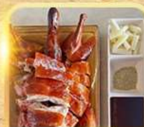
เปิดปาทัง