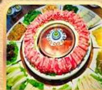
สุกีสโตลมองโก