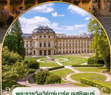
พระราชวังแวร์ซายส์ ฝรั่งเศส