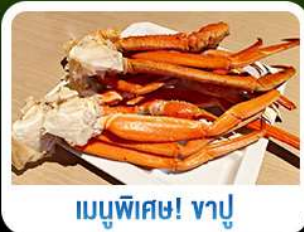
เมนูพิเศษ! ซาซิมิ