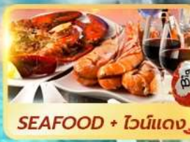
SEAFOOD + ไวน์แดง