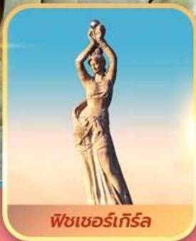
พีชเซอร์เก็รล