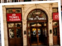
สถานีทูนเนล (TUNEL STATION) สถานีรถไฟใต้ดินสายเก่าแก่ และเป็นหนึ่งในระบบขนส่งที่เก่าแก่ที่สุดในโลก