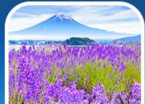
สวนโออิชิ ปาร์ค