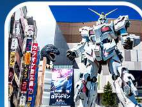
ช้อปปิ้งชินจูกุ+กินดัมยักษ์