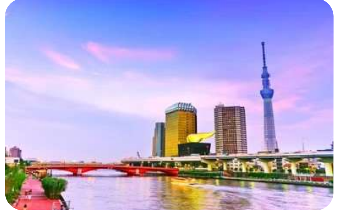
แม่น้ำสุมิดะ

สักการะ วัดมัตสึจิยามะโชเต็น หรือ "วัดหัวไชเท้า" เป็นวัดเก่าแก่ในย่านอาซากุสะ ตั้งอยู่บนเนินเขาเล็ก ๆ ใกล้แม่น้ำสุมิดะ จุดเด่นคือเป็นวัดที่ขึ้นชื่อเรื่อง "ขอพรด้านการเงิน โชคลาภ และความสำเร็จในธุรกิจ" ส่วนไฮไลต์สำคัญของวัดนี้ คือ ไตคอน หรือ หัวไชเท้า สัญลักษณ์ศักดิ์สิทธิ์ คนที่นี้เชื่อว่าไตคอนช่วย "ชำระล้างสิ่งไม่ดี" และนำโชคลาภเข้ามา นักท่องเที่ยวมักนำไตคอนไปถวายเพื่อขอพร