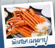
พิเศษ! เมฆหามูจิ