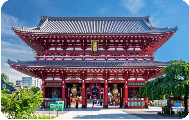
วัดอาซากุ

รับประทานอาหารเช้า ณ ห้องอาหารของโรงแรม (มื้อที่ 4)