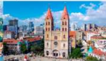
โบสถ์คริสต์เซนต์ไมเคิล

*ทางบริษัทฯ ขอสงวนสิทธิ์ในการสลับโปรแกรมทัวร์ตามความเหมาะสมขึ้นอยู่กับสถานการณ์หน้างาน โดยคำนึงถึงผลประโยชน์ของลูกค้าเป็นสำคัญ