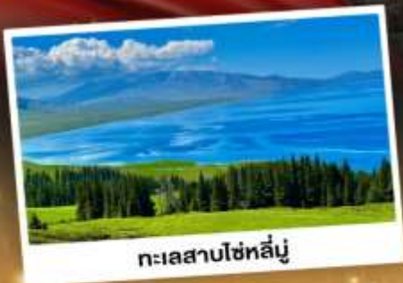
ทะเลสาบไซทาลีนู

ชมวิวดอกดอกลังการแบบยุโรปผสมเอเชีย กุ้งหนุ่ยจ้าวดำ ทะเลสาบสีเทอร์ควอยซ์