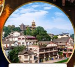
เมืองโบราณฉือจี้โฮ่ว