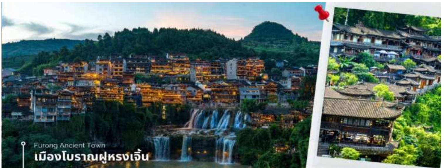
Furong Ancient Town เมืองโบราณฟูหลงเจิ้น

ท่านสามารถ ชมโชว์วัฒนธรรมฟูหลงโบราณ (หากสภาพอากาศไม่อำนวย จะงดการแสดง) จากนั้นนำท่าน ชมความงาม น้ำตกฟูหลง ซึ่งเป็นเอกลักษณ์ของเมืองฟูหลง เป็นน้ำตกที่อยู่ใจกลางเมือง ถ้ามองจากฝั่งตรงข้ามจะดูเหมือนว่าเมืองตั้งอยู่บน หน้าผาที่มีน้ำตกไหลอยู่ข้างล่าง น้ำตกนี้มีขนาดกว้างประมาณ 40 เมตร และสูงประมาณ 60 เมตร ซึ่งความพิเศษอีกอย่าง ของที่นี่คือ เราสามารถเดินผ่านด้านหลังม่านน้ำตกได้