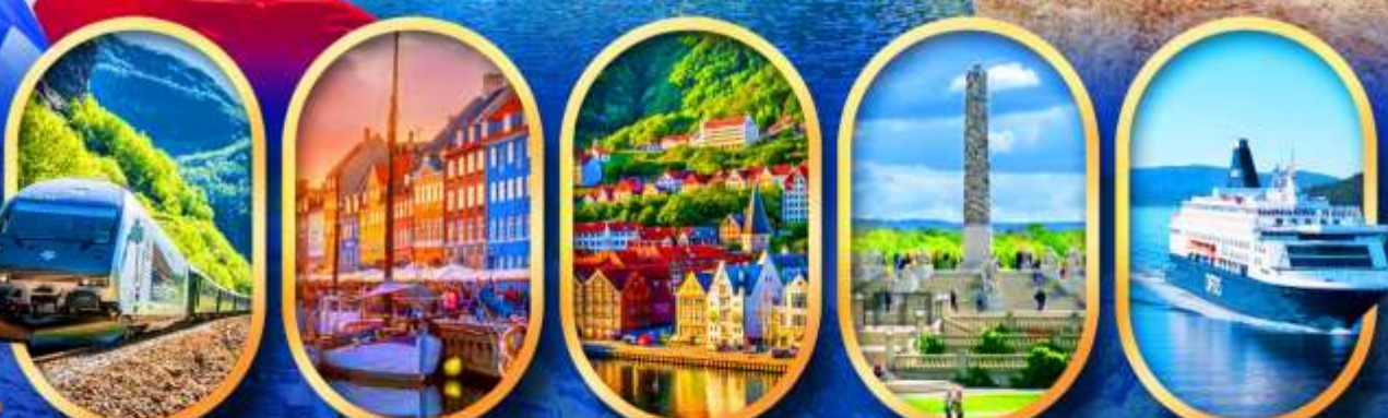
รถไฟฟลิมสบาน่า ท่าเรือฮาวน์ พักเมืองเบอร์เก็น วิกเทอร์แลนด์ นั่งเรือ DFDS