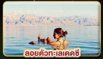
ลอยตัวทะเลเดคซี