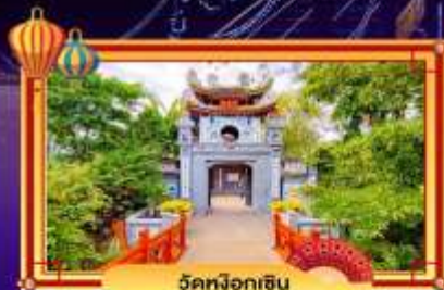
วัดนพอกอิน