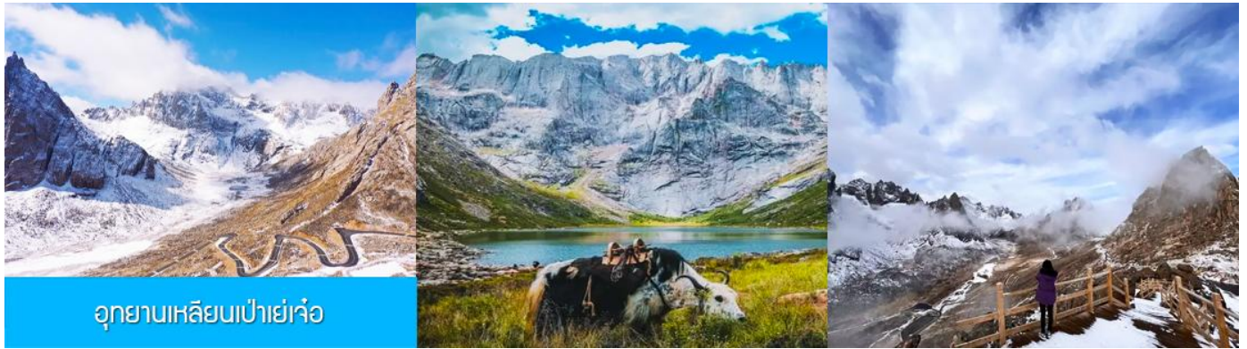
อุทยานเขลิยนเป่าเย่เจ้อ

พักที่ โรงแรม ZUNGE ZHUOYUE HOTEL ระดับ 4 ดาวท้องถิ่นหรือเทียบเท่าในอำเภออาป่า