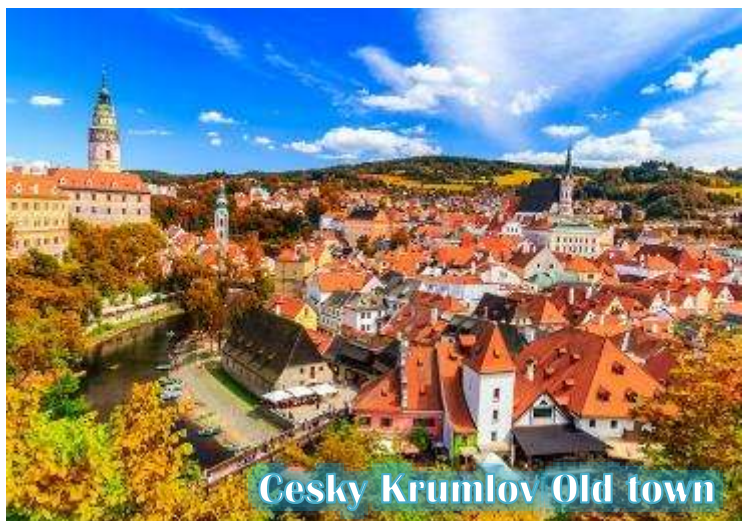
Cesky Krumlov Old town

บ่าย นำท่านเดินทางสู่ “เมืองเชสกี้ คุมลอฟ (เมืองมรดกโลก)” เป็นเมืองขนาดเล็กในภูมิภาคโบฮีเมียใต้ของ สาธารณรัฐเช็กมีชื่อเสียงจากสถาปัตยกรรม และศิลปะของเขตเมืองเก่าและปราสาทคุม ลอฟ ที่ยังคงมีเสน่ห์เหมือนอยู่ในเทพนิยายมา จนถึงทุกวันนี้ และน่าจะเป็นเมืองที่สวยงามที่สุดใน สาธารณรัฐเช็ก, เชสกี้ คุมลอฟได้รับการจัด อันดับให้อยู่ในสิบเมืองที่สวยงามที่สุดในโลก เป็น หนึ่งในสถานที่ที่สวยงามที่สุดและไม่ควรพลาด ในการเดินทางไปสาธารณรัฐเช็ก เดินเล่นไปบน ถนนในยุคกลาง ปราสาทสไตล์บาโรกที่ไม่บุบ สลาย และแม่น้ำที่คดเคี้ยว เมืองเก่าที่งดงามแห่งนี้ได้รับการอนุรักษ์ไว้อย่างดีจากอดีตและการทิ้งระเบิดใน สงครามโลกครั้งที่ 2 ทั้งหมดทำให้เมืองที่มีทิวทัศน์แห่งนี้รู้สึกเหมือนอยู่ในเทพนิยายจากยุคกลางสู่ความเป็นจริง