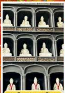
วัดโงชิซังเซอิโดจิ