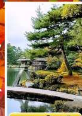
สวนเคนโระคุเอ็ง

☁️ ออนเซ็น 3 คับ 🧳 นน.กระเป๋า 23 กก. 🌞 7Days 5Night