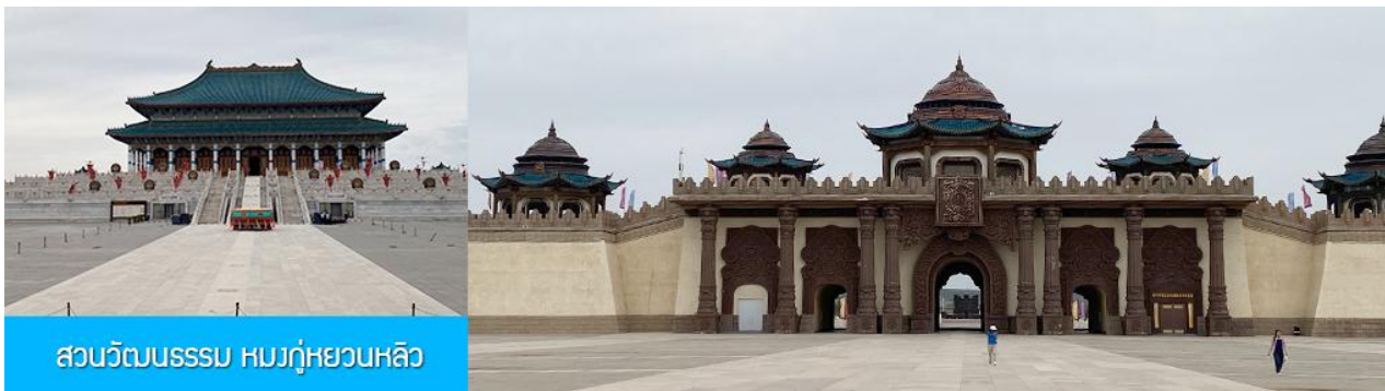
สวนวัฒนธรรม หมงู่หยวนหลิว

หลังอาหารนำท่าน เที่ยวชม จวนอ๋องจวินหวัง 郡王府 จวนแห่งนี้เริ่มสร้างขึ้นในปี ค.ศ. 1902 สร้างเสร็จในปี ค.ศ. 1936 เป็นที่พำนักของ อ๋องอีฉีจวินหวัง 伊旗郡王 เป็นจวนอ๋องเพียงหนึ่งเดียวได้รับการอนุรักษ์ในสภาพที่สมบูรณ์ โครงสร้างทำด้วยอิฐ หิน และไม้ ประกอบด้วยห้องพัก 16 ห้อง เป็นสถาปัตยกรรมผสมแบบมองโกล ทิเบต และฮั่น