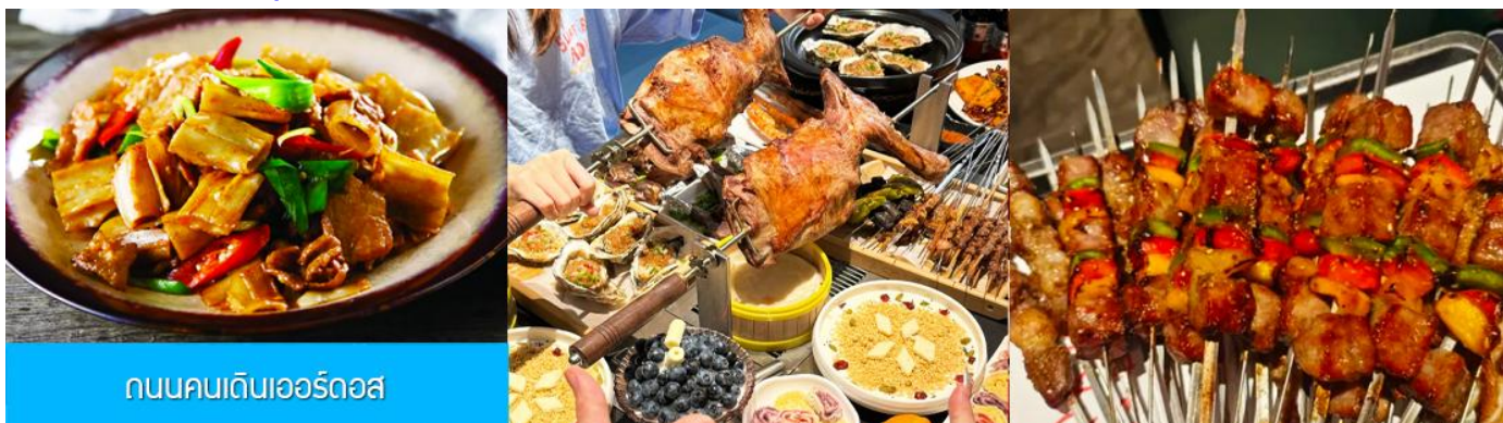
ถนนคนเดินเออร์ดอส

นำท่านเที่ยวชม สวนวัฒนธรรมหมงู่หยวนหลิว 蒙古源流 เป็นอุทยานท่องเที่ยวเชิงประวัติศาสตร์และวัฒนธรรมระดับ 4A ของจีน ที่เป็นต้นกำเนิดของชนชาติและวัฒนธรรมมองโกล สะท้อนความเป็นจักรวรรดิที่ยิ่งใหญ่เมื่อ 700 ปีก่อน ชม ประตูจงเทียน 崇天门 สุนคโพนารที่แสดงถึงความยิ่งใหญ่ของจักรวรรดิมองโกล ชม จัตุรัสเถิงเก่อหลี่ 腾格里广场 จัตุรัสกลางแจ้งขนาดใหญ่ที่ใช้ประกอบพิธีกรรมต่าง ๆ