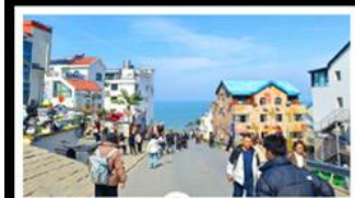
ถนนคอปเปลิ่งหมายเลข 8

สัมผัสความยิ่งใหญ่ของ 4 เมืองสำคัญ ชิงเต่า - เยียนโก - เฟิงไห่ - เว่ยไห่ ปาต้ากวน - โบสถ์คาทอลิก - ตึกเก่าริมหา