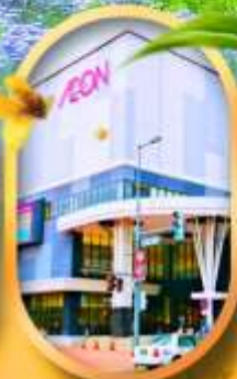
อออนมอลล์