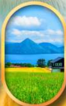
ทะเลสาบโทโยะ