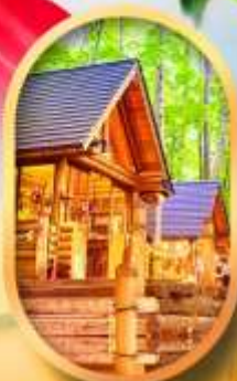
บึงเทิลเกออส