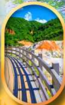
โนโบริเบ็ตสึ