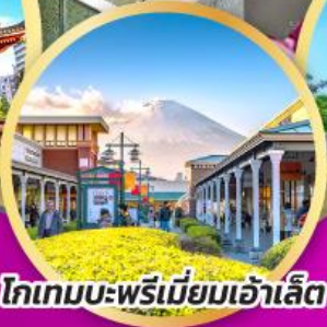
โทเกมบะพรีเมียมเฮ้าส์